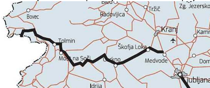
Slika 2: Potek 4. razvojne osi

Žiri) s stičiščem v Škofji Loki (Občina Škofja Loka) se Severna Primorska (Baška Grapa, Cerkno, Idrija) povezuje z Ljubljano. Tako skozi območje LAS poteka 4. razvojna os, ki Ljubljano preko Škofje Loke in Poljanske doline povezuje s Primorsko in naprej z Italijo.